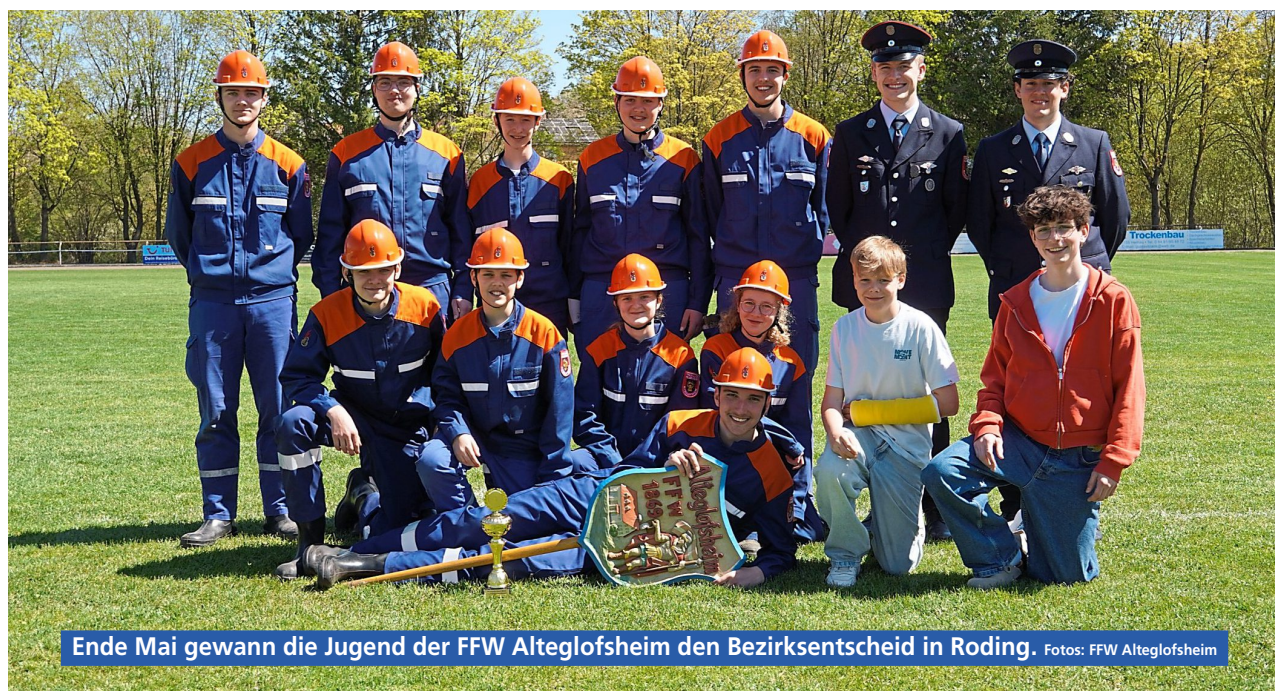
Ende Mai gewann die Jugend der FFW Altglofsheim den Bezirksentscheid in Roding.

Jugendfeuerwehren boomen wie nie zuvor. Ein Besuch bei der erfolgreichsten Nachwuchsgruppe der Oberpfalz nahe Regensburg zeigt, was den Verein so beliebt macht.